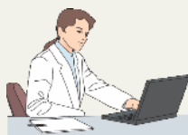
電子カルテから 検査オーダー